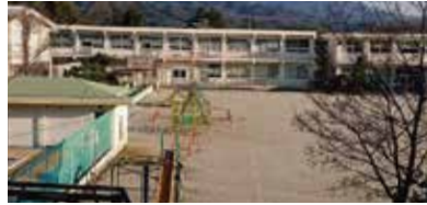
●中山小学校スケジュール

中山小学校の教室不足と体育館の手狭感等が課題となっています。 更に、園児の増加により中山こども園の待機児童の課題もあり、先生方や地域住民から増築の要望がありました。 この度、令和3年度増築の予算化が実現しました。