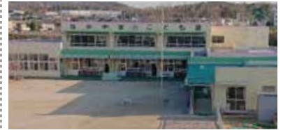
●中山こども園スケジュール